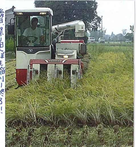
後日、祭り田んぼも稲刈り終了!!