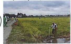
Kさん チーム で調査