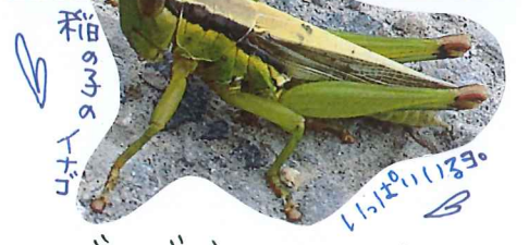
稲の39 イナゴ 11月11日