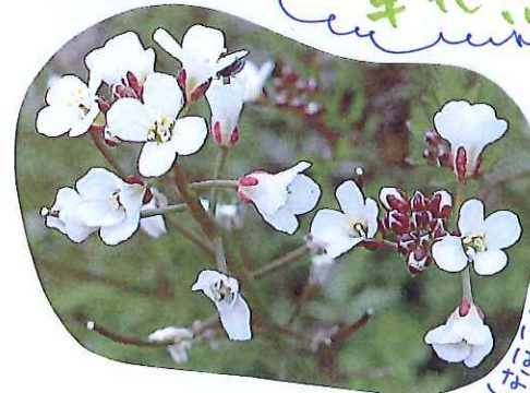
種つけ花たねつけ花