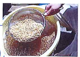
もちろん金ザリで すくってから... 残りがすくには... とこそ「ホス!!」

今年は... 新グッズ登場!! ホス!! 金魚すくいの網です(笑) もちろ紙製の網なく、70センチ70センチの 娘(三女)が「糸網にヤリは...というの」 おもち箱から持ってきては... 意外と便利??