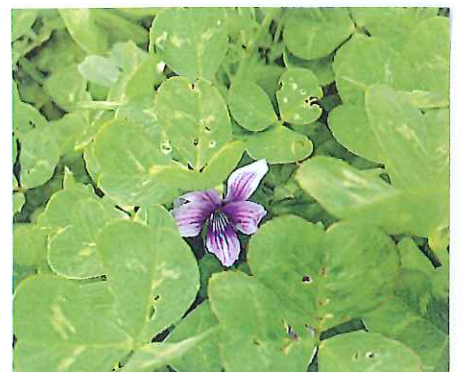
♪ローバーのしげみの中に...おみれの花!! カキス!!

満開の様を春の雨風が流し、季節は早くも次へ進もうと しています。みなさん、いかがお過ごしですか? 網本欣-田んぼの 田舎(あせ)も魚釣かね緑と野草の花咲々とよみきれですよ!!