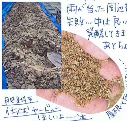
肥料4kg 仕込おセー1kg ぼいよー1kg 風限1kg