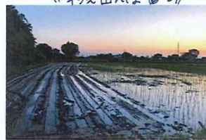
2019年キ-ワド!! 大雨と台風で かんぼろいせんとジおから炭酸肥料 地域最遅田植え、そしてイベントで お会いできた百さんの楽しい時間!!

ともしさやかれまいたか、梅雨明けて関東は晴天が続き、持ちこたえました!!...か!