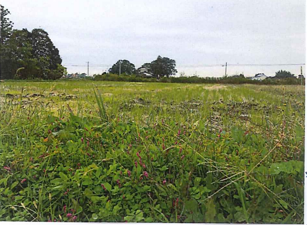
朝夕冷えて草に 板露輝かして こえ!!